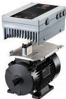
Устанавливайте FCP 106 на любой двигатель

Программные средства ПК: VLT® Motion Control Tool MCT 10 идеально подходит для ввода в эксплуатацию и обслуживания привода с подключенным асинхронным электродвигателем.